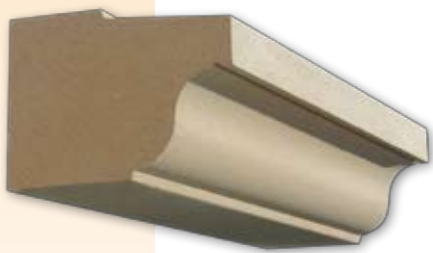
Bandeau à maçonner

Réussir une façade, c'est savoir jouer avec les proportions, les volumes et les reliefs. Avec un profil élégant, le bandeau a un rôle essentiellement décoratif. Il permet de bien répartir des surfaces d'enduits et donne du relief à votre façade. Suivant l'éclairage, le bandeau dépose des ombres qui font vivre harmonieusement votre façade. En fonction de la nature du projet, Weser a prévu deux types d'éléments : le bandeau à maçonner et le bandeau à agrafer.