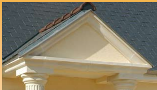
Fronton réalisé avec bandeaux à maçonner