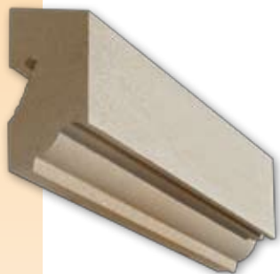
Bandeau à agrafer